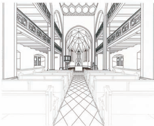
Schnitt durch das Schiff mit Chorraum und Emporen

Perspektive von den hinteren Kirchenbänken aus auf den neugestalteten Chorraum (Personen am Altar sind besser als vorher sichtbar).