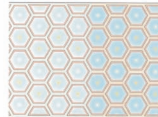
Planung / Bestand Facettendecke

Unser Gotteshaus wird einladend hell. Es werden die Farben weiß, beige und lichte Grautöne unsere Kirche beherrschen. Ein sanftes Rot und Himmelblau werden Akzente setzen. Diese Farben werden Bänke, Emporen, Chorraum und Schiff bestimmen und eine Einheit bilden. Diese Farben tauchen auch in der Facettendecke wieder auf. Altar, Taufstein und Ambo werden durch das dunkle Grau dazu einen Kontrast bilden, der die Fundamente unseres Glaubens (die beiden Sakramente und die Wortverkündigung) darstellt.